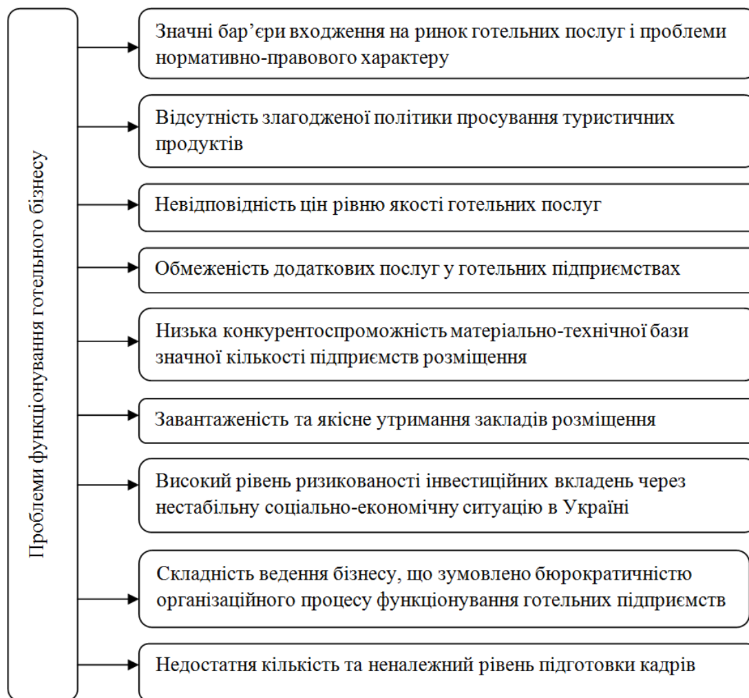
Рис. 2. Проблеми функціонування готельного бізнесу в Україні (побудовано автором на основі [2, 6])

Висновки із зазначених проблем і перспективи подальших досліджень у подальшому напрямі. Готельний бізнес є головним чинником та основною складовою туристичної інфраструктури. Незважаючи на існуючі проблеми, зацікавленість в готельному бізнесі в Україні продовжує зростати. Готельний бізнес динамічно розвивається та є достатньо перспективним для інвестування.