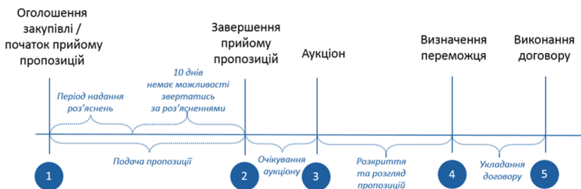
Рис. 2. Етапи проведення відкритих торгів [2]

Схема здійснення державних закупівель, зокрема проведення відкритих торгів, передбачає декілька етапів (рис. 2).