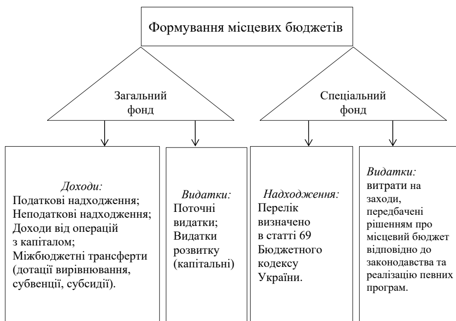
Рис. 1. Складники місцевих бюджетів

Відповідно до чинного порядку встановленого бюджетного законодавства здійснюється розроблення бюджетів розвитку (або інвестиційних бюджетів), які мають важливе значення для фінансового забезпечення розширеного відтворення на відповідних територіях та реалізації програм соціально-економічного розвитку сільських територій [4, с. 168]. До закріплених видатків бюджетів слід віднести ті, які не підлягають секвестру, тобто скороченню незалежно від обсягів фінансування, склад поточних видатків місцевих бюджетів наведемо на рисунку 3. Складові частини загального і спеціального фонду місцевих бюджетів наведено в таблиці 1.