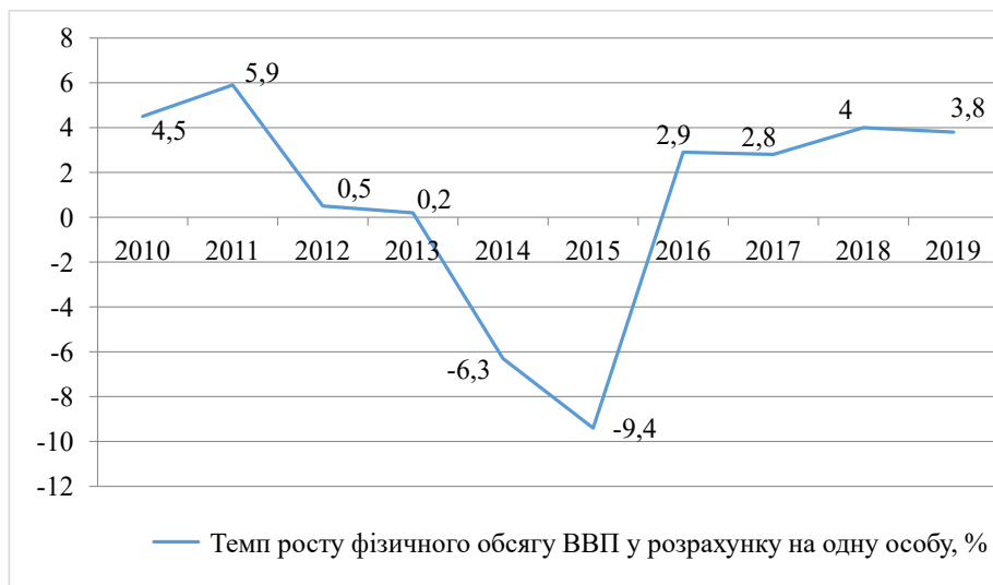
Рис. 1. Темпи зростання (падіння) фізичного обсягу ВВП у розрахунку на одну особу протягом 2010–2019 років

Згідно з рис. 2, індекси рядів динаміки (2010–2020) ВВП у фактичних цінах, фізичного обсягу ВВП та зайнятості населення свідчать про значне випередження індексів ВВП у фактичних цінах порівняно з темпами зростання фізичного обсягу ВВП і зайнятості населення, починаючи з 2014 року, що викликано геополітичною кризою, девальвацією національної валюти. Крива фізичного обсягу ВВП проходить паралельно з лінією зайнятості населення. Розглянута динаміка означає, що рівень ВВП у фактичних цінах зростає переважно за рахунок перманентного збільшення цін на споживчу продукцію, а не за рахунок фізичного обсягу виробництва продукції. І, оскільки на державному рівні, як згадано вище, одним із завдань є забезпечення стійкого зростання ВВП на основі модернізації виробництва, розвитку інновацій, підвищення експортного потенціалу, виводу на зовнішні ринки продукції з високою часткою доданої вартості, виникає