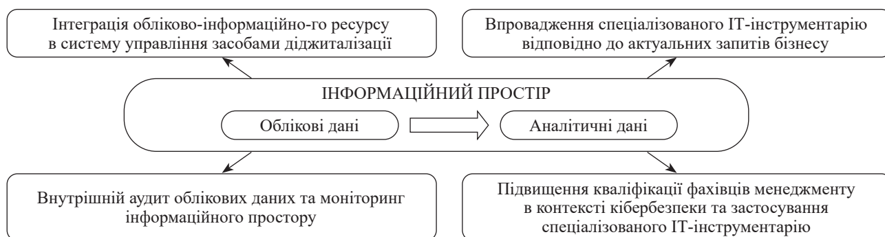
Рис. 2. Алгоритм оптимізації обліково-інформаційного ресурсу для потреб менеджменту суб'єкта підприємництва