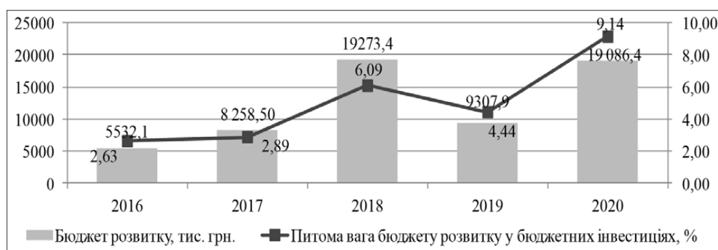
Рис. 3. Динаміка доходів бюджету розвитку як джерела фінансування бюджетних інвестицій м. Кременчука

Джерело: розраховано та побудовано на основі [13]