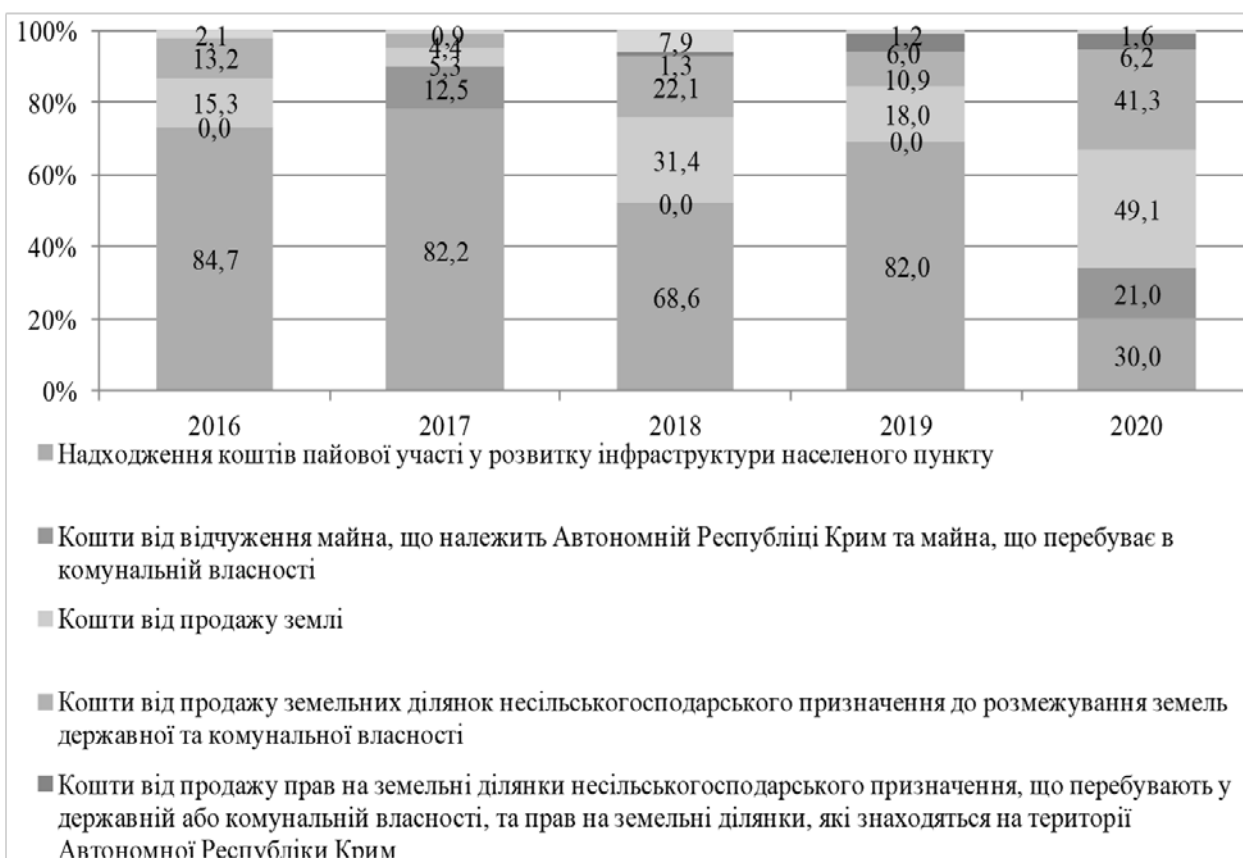
Рис. 4. Динаміка структури доходів бюджету розвитку за 2016–2020 рр., %